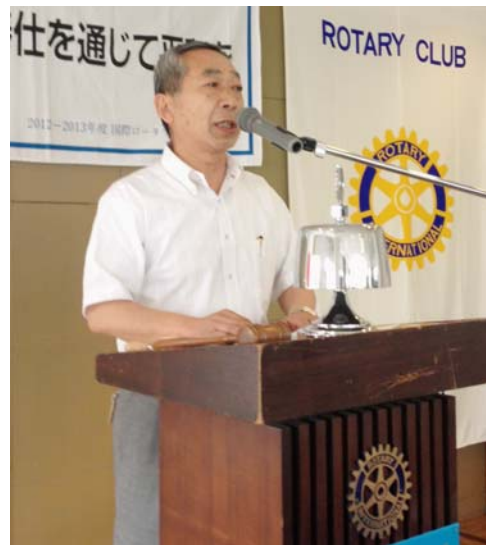
本日の卓話、山口会員